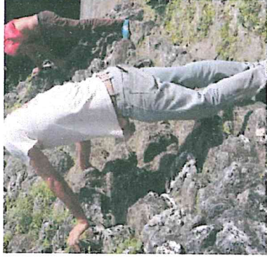
Foto 4. Edificio 1, Grupo Mater, Yaxha