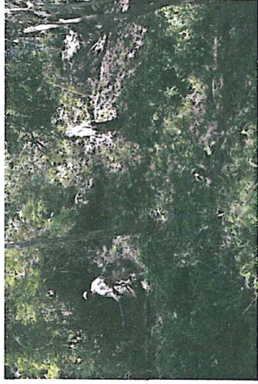
Foto 7. Trabajos de chapeo en El Pital

6. Como parte del programa de monitoreo y mantenimiento de sitios arqueológicos de este parque se visitó el sitio El Pital, el cual se distingue por su complejidad arquitectónica. Parte del trabajo implicó despejar el camino vehicular de acceso, así como realización de chapeo, estimación del área con GPS, lacual asciende a 2.19 has, así como verificación del estado de conservación, lo que incluyó verificar que no se han presentado nuevos saqueos.