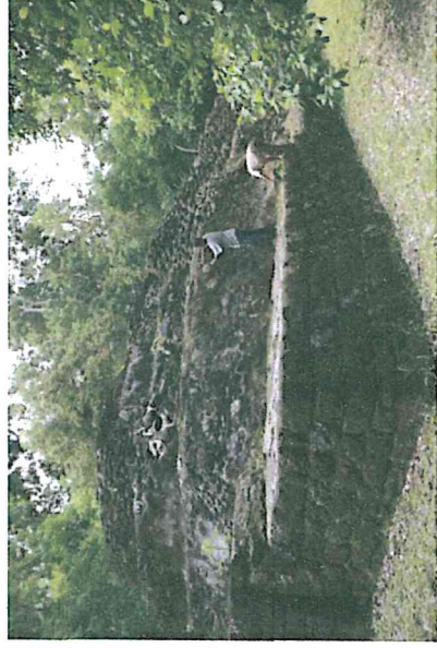
Foto 5. Edificio 90, Plaza B, Yaxha