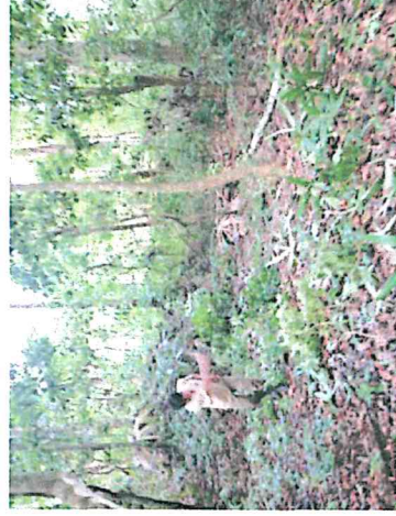
Foto 8. Limpieza de maleza en Kanajau

modo adicional se marcaron las coordenadas de la laguna, que puede proveer un apoyo logístico al momento de necesitar acampar.