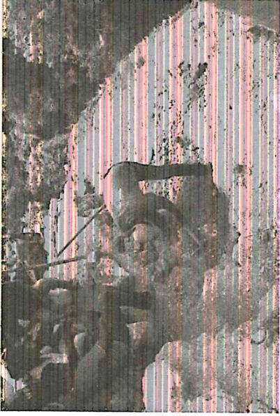
Foto 12. Trabajos de excavación en el cuerpo superior Edificio 137, Acrópolis Norte, Yaxha,