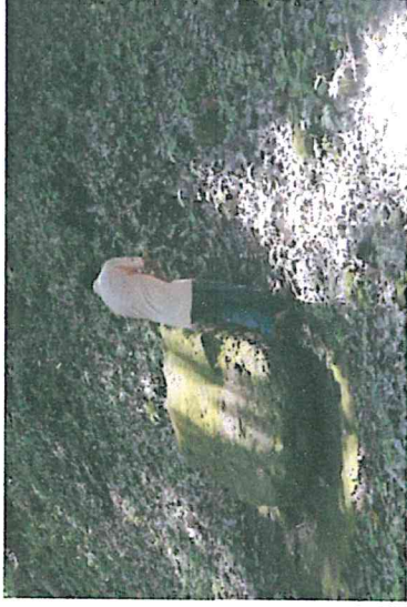
Foto 6. Estela en Plaza G, Yaxha

6. Como parte del programa de monitoreo y mantenimiento de sitios arqueológicos de este parque se visitó el sitio El Pital, el cual se distingue por su complejidad arquitectónica. Parte del trabajo implicó despejar el camino vehicular de acceso, así como realización de chapeo, estimación del área con GPS, lacual asciende a 2.19 has, así como verificación del estado de conservación, lo que incluyó verificar que no se han presentado nuevos saqueos.