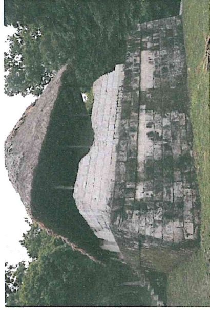
Foto 3. Edificio 134, Acrópolis Norte, Yaxha

2. En el Edificio 134 de la Acrópolis Norte se desarrollaron trabajos de limpieza de maleza, así como desyerbe y chapeo en sus distintos cuerpos constructivos. Se buscaba evitar que el crecimiento de la maleza provoque agrietamientos que a su vez permitan filtraciones de agua que pongan bajo riesgo su integridad estructural. En total se abarcaron 2160 m 2 .