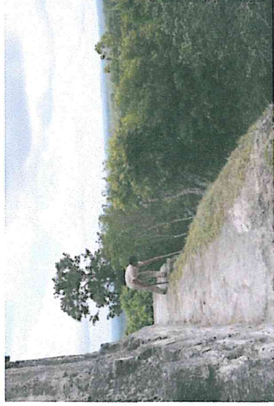
Foto 2. Edificio 216, Acrópolis Este, Yaxha

2. En el Edificio 134 de la Acrópolis Norte se desarrollaron trabajos de limpieza de maleza, así como desyerbe y chapeo en sus distintos cuerpos constructivos. Se buscaba evitar que el crecimiento de la maleza provoque agrietamientos que a su vez permitan filtraciones de agua que pongan bajo riesgo su integridad estructural. En total se abarcaron 2160 m 2 .