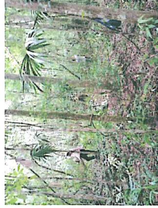
Foto 9. Trabajos de chapeo en Balam Chac

8. Como parte del programa de monitoreo y mantenimiento de sitios arqueológicos de este parque se visitó el sitio Balam Chac. Para ello se buscó y encontró un acceso practicable, localizando una laguna. Las actividades realizadas consistieron en monitoreo del estado de conservación del sitio, de donde se observó que no se han producido nuevos saqueos. Además, se realizó chapeo en la plaza principal; con ayuda del GPS fue posible conocer el área del sitio: 1.5604 has.