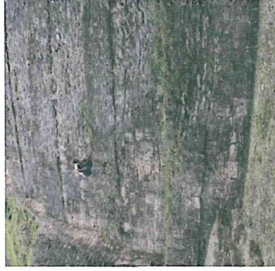
Foto 1. Limpieza de maleza, Edificio 216, Acrópolis Este, Yaxha